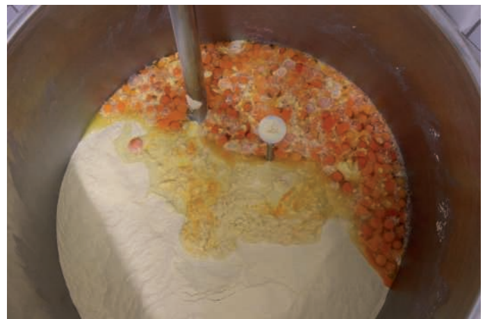
Nichts außer Eier und Grieß kommt an die Nudeln der Spechts