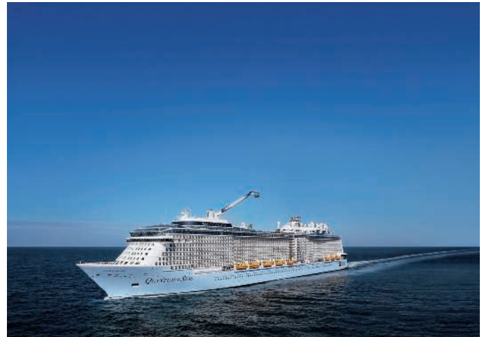
Ob Schwimmbad, Kabine, Royal Esplanade oder Spa – EC-Ventilatoren schaffen ein gutes Klima auf hoher See

Eine der größten Herausforderungen bei der Schiffsklimatisierung ist der geringe Platz. Die Lüftungstechnik muss daher so wenig Platz wie möglich einnehmen. Unter anderem deshalb sind leistungsstarke ebm-papst EC-Radialgebläse mit vorwärts