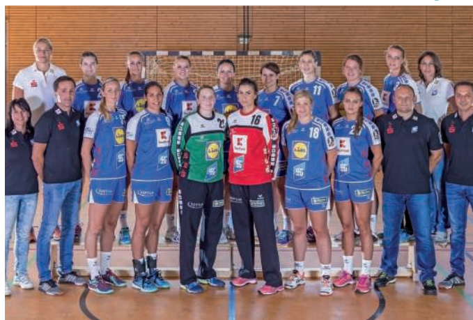
Die Trikots werden bunter, nun sind auch Kaufland und Lidl dabei

„Der Aufstieg der Neckarsulmer Handballerinnen in die 1. Bundesliga ist ein toller Erfolg, auf den wir in unserer Region sehr stolz sind. Diese außergewöhnliche Leistung wollen wir mit unserem Engagement weiter fördern“, erklärt eine Unternehmenssprecherin. „Frauen gehören in unserem Unternehmen ebenfalls zu wichtigen Leistungsträgern und die Förderung von erfolgreichen Frauen ist uns daher auch als Sponsor ein wichtiges Anliegen.“ „Mit Kaufland und Lidl konnten wir zwei der größten Unternehmen in Neckarsulm und der Region