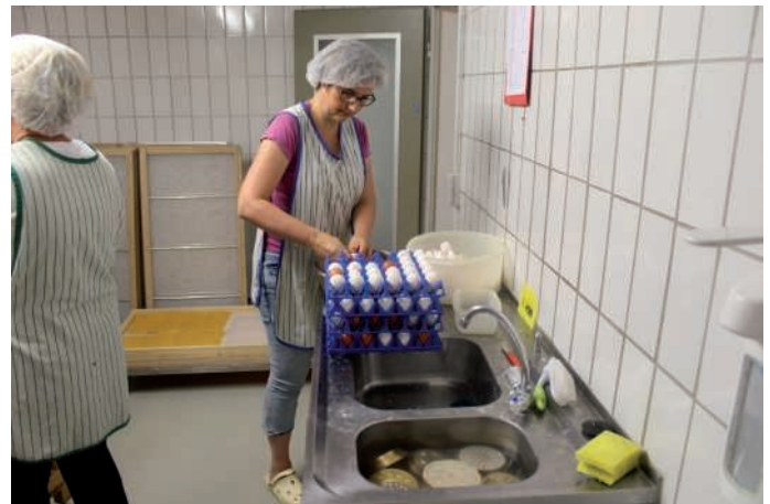
Das Aufschlagen der Eier ist Chefsache