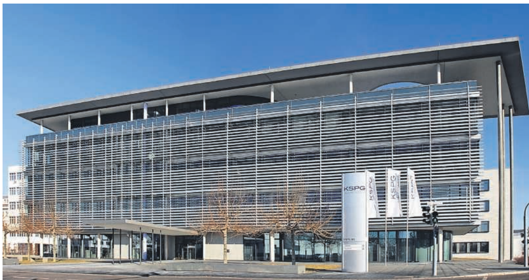
Unternehmenssitz KSPG AG in Neckarsulm