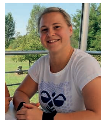
Beim Interview zeigt die 25-Jährige ihre Lockerheit, die sie ausmacht.

Das ganze Interview und weitere Bilder finden Sie auf lokalmatador.de .