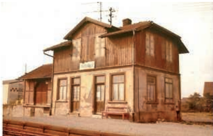
Blick aus Nordost