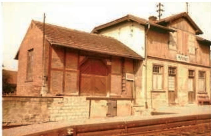
Blick aus Südost