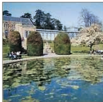
zum Beispiel Wilhelma, Stuttgart

Weitere Ermäßigungen gibt es für: Sea Life Konstanz, Pfänderbahn Bregenz, Auto & Technik Museum Sinsheim u.v.m.