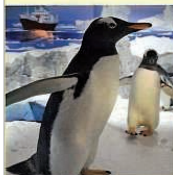
zum Beispiel SEA LIFE, Konstanz