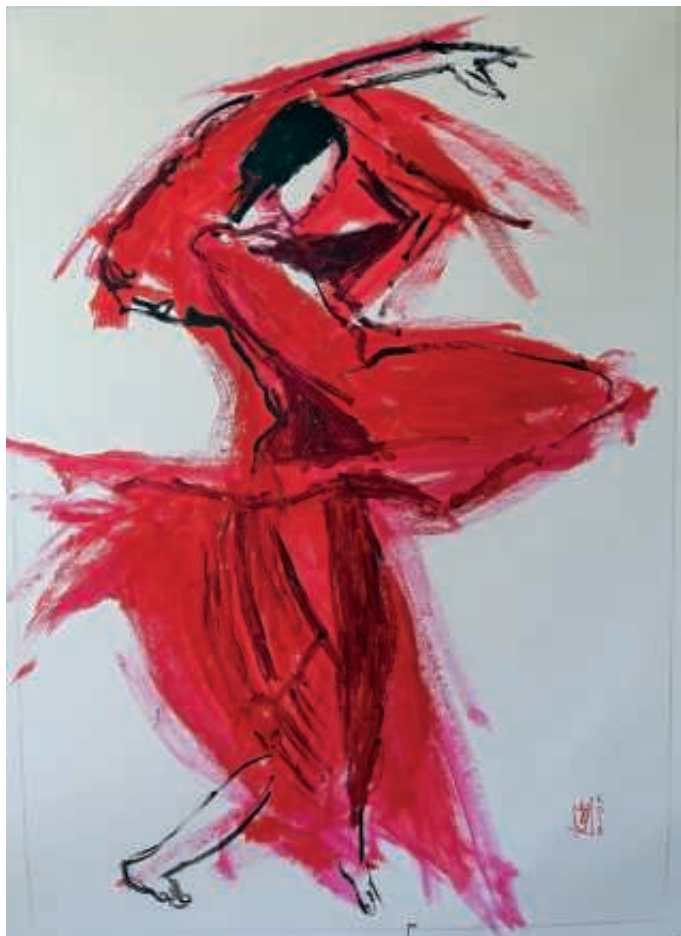
Ein Werk von Volker Glatz