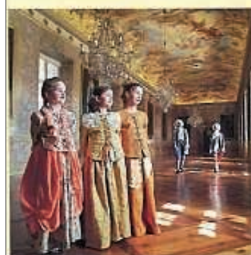
zum Beispiel Schloss Ludwigsburg mit Blühendem Barock und Märchengarten