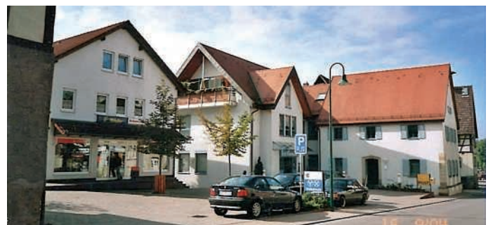
„Erste Sahn“ Fürll-Bank-Bräuchle und Parkplätze