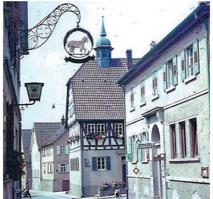
Das gut bekannte „Lamm-Schild“

Die Scheune inkl. äußerem Zubehör von E. Bräuchle wurde 1993 abgerissen. Die entstandene Fläche wurde mit dem Volksbankgebäude überbaut. Vom vorderen Teil des Grundstücks wurden Parkplätze angelegt. Aus dem Großprojekt Fürll-Volksbank-Gemeinde (Parkplätze) ist ein sehenswertes Schmuckstück entstanden.