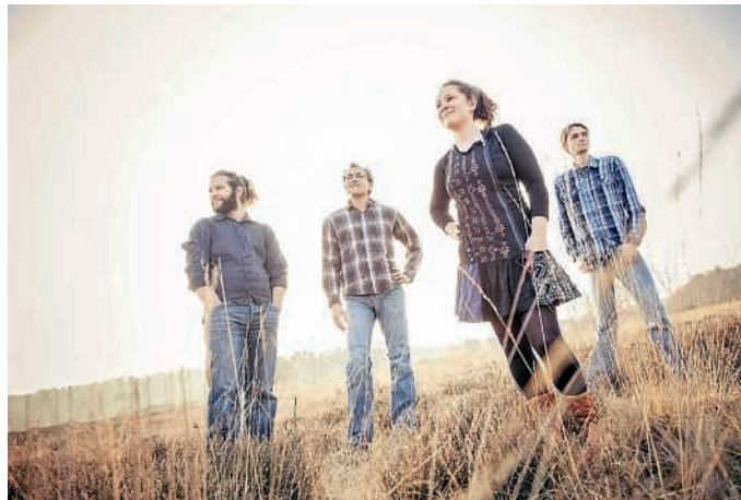
Die Band Crosswind eröffnet das Folk am Neckar Festival.

Die zweite Formation am Freitagabend kommt aus Irland, heißt Scannal und bietet etwas ganz Besonderes: eine fließende Mischung aus High Energy Traditionals, Technobeats, Chart-Hits, Rap - übergangslos vom einen ins andere. Keiner weiß, wie Scannal diese Live-Trad-Disco mit Pogo, Polka, La-Ola und Headbanging hinaubern. Aber eines ist sicher: Am Ende tanzt die Oma mit dem Enkel, die Schwiegermutter mit dem