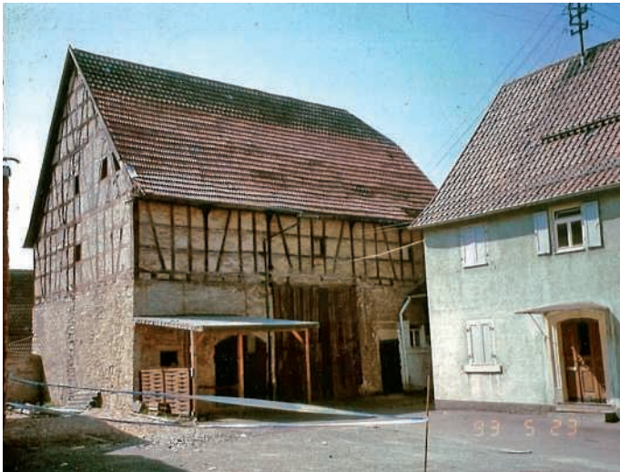
Scheune E. Bräuchle

Beschreibung Karl Heinz Haas.