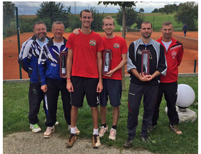
Das Foto zeigt die Sieger der Plätze 1 - 3.

Wir bedanken uns bei allen teilnehmenden Mannschaften für die Teilnahme und natürlich bei den Helfern, die dieses Fest möglich gemacht haben.