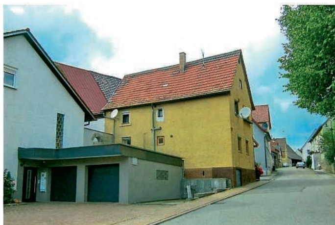
Aktuell August 2017