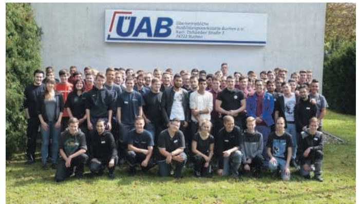
Die neuen Auszubildenden des Ausbildungsjahres 2017/18.

gen Weiß. Ein ÜAB-Teamtraining zum Ausbildungsbeginn fördert diese Fähigkeiten. Beste Bedingungen also für die neuen Auszubildenden, sich in ihren Berufen zu qualifizieren und damit die Basis für einen erfolgreichen Abschluss ihrer Ausbildung zu legen.