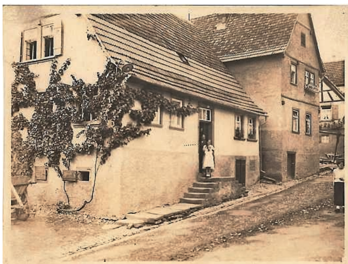
Haus mit Personen v. Traubenstock um 1935, im Hintergrund Haus Dratz heute Fam. Horsch