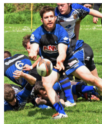
Die NSU-Rugger überzeugten beim Pokalspiel in Stuttgart

ten Einsatz der Saison und hinterließ durch einige starke Läufe an der Außenlinie einen durchweg positiven Eindruck. Für das Team von Mark Kuhlmann gilt es nun, sich in den nächsten 10 Tagen mit voller Konzentration auf das Spiel gegen den Sportclub Neuenheim in der Rugbyhochburg Heidelberg vorzubereiten. Mit einem Sieg auf dem Museumsplatz, wäre ein großer Schritt in Richtung Klassenerhalt getan. (khl - Foto: Leitz)