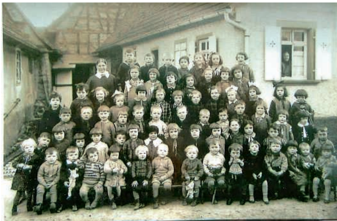
Gegenüber der alten Kinderschule; Foto von 1930