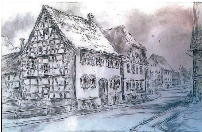
„Ohne Sonne“, Staugasse links Haus Schneider, Hübner und folgende

Nach Abbruch der ehemaligen Sonne 1967 war die Fachwerk-Giebelseite des Doppelhauses Schneider an der Staugasse nur kurze Zeit zu sehen. Edgar John hat die Gelegenheit malerisch wahrgenommen, bevor der Neubau wieder alles verdeckte.