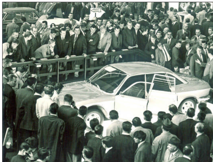
1967 auf der IAA in Frankfurt Mittelpunkt des Interesses: Noch im gleichen Jahr wurde der Ro 80 zum „Auto des Jahres“ gewählt

Besucher der Ausstellung „Revolution - 50 Jahre NSU Ro 80“ sehen neben den Exponaten zur Modell-Entwicklung verschiedene Varianten dieses Autos. Ausgestellt sind unter anderem der älteste Ro 80 in Originalzustand, der private Ro 80 von Felix Wankel, Design-Studi-