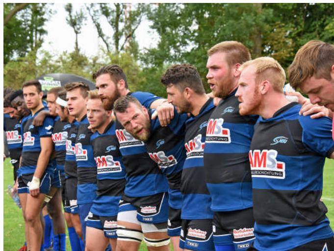
Die Blau-Schwarzen aus Neckarsulm wurden beim 58:0-Sieg ihrer Favoritenrolle gerecht.