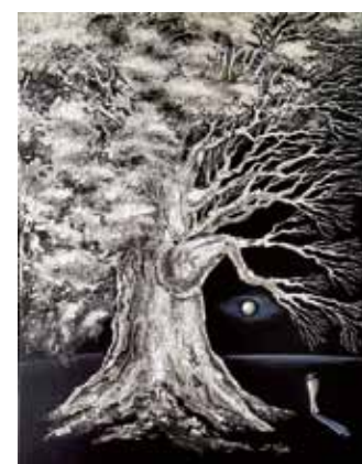
Black & White

Bei der Wahl der Bildmotive gibt es kaum Beschränkungen. Realistische Darstellung ist genauso aktuell wie abstrakte Formen oder Liniensprache. So wie ein Fluss nicht stehen bleibt und weiter fließt, übernimmt die Kunst die Vielseitigkeit der