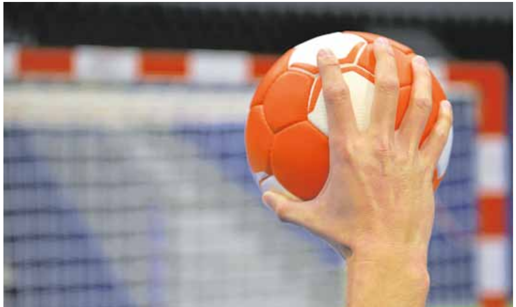
Göpping pflegt Kooperationen mit weiteren Handballvereinen der Region, um dem Nachwuchs eine optimale Förderung ermöglichen zu können.

Der Verein erhält das Jugendzertifikat seit 2011 bereits zum siebten Mal, was zeige, dass Göppingen zu einer der Top-Ausbildungsadressen des deutschen Handballs zähle, so die Göppinger in einer Pressemeldung.