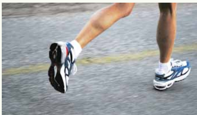
Seit Dezember können sich interessierte Sportler zum Stuttgart-Lauf anmelden.

Intensivierung der Zusammenarbeit mit den Kooperationsvereinen war ein wichtiger Schritt im Bereich der Anschlussförderung im Leistungsbereich. Ich freue mich, dass wir mit unserem Konzept die Lizenzierungskommission der DKB HBL überzeugen konnten und erneut mit dem Jugendzertifikat ausgezeichnet wurden.“