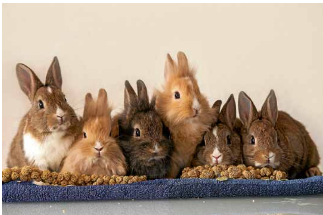
Kaninchen sind Cilli Siedls Lieblingsmotiv.

Schon seit frühester Kindheit interessiert sich Cilli Siedl für Tiere. Einige Jahre später kam ein weiteres Hobby hinzu, das sie bis heute begleitet: das Fotografieren. Rasch wurden die eigenen Tiere, vor allem Kaninchen, zu Cillis liebstem Fotomotiv. Auch die Tiere im weiteren Familienkreis wurden immer professioneller abgelichtet, bis schließlich auch Freunde und Bekannte ihr Haustier zu einem „Fotoshooting“ vorbeibrachten. So ist im Laufe von Jahren eine riesige Fotosammlung entstanden, die mittlerweile weit über 100.000 Aufnahmen umfasst. Aus ihnen wurde nun eine kleine Auswahl zusammengestellt. Den Schwerpunkt bilden