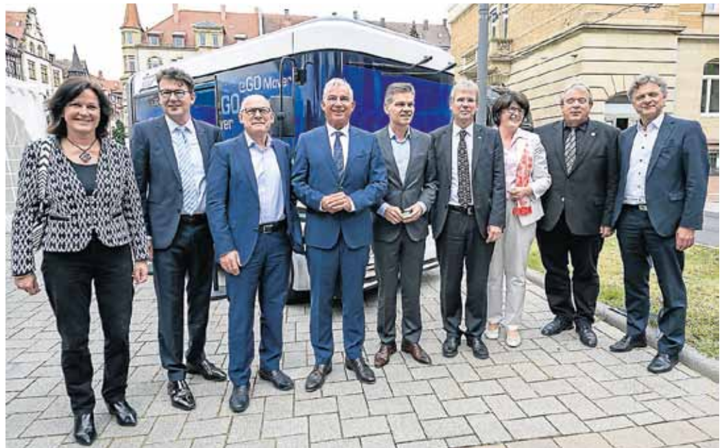
Gäste aus Politik, Wirtschaft und Forschung vor einem autonom fahrenden Kleinbus in Karlsruhe.

„Das Testfeld für autonomes und vernetztes Fahren Baden-Württemberg in Karlsruhe, Heilbronn und Bruchsal steht für eine innovative Zusammenarbeit von Landesregierung, Wissenschaft, Kommunen und dem Karlsruher Verkehrsverbund KVV bei einem zukunfts-