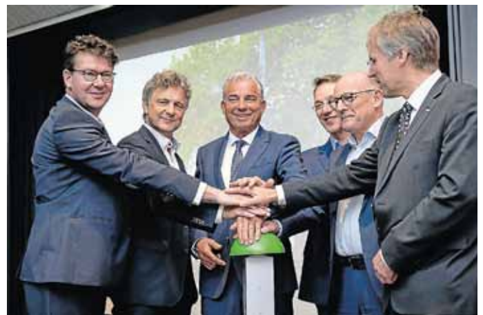
Der offizielle Start für das Testfeld hat begonnen.

Für Konzeption, Planung und Aufbau des Testfelds stellte das federführende Verkehrsministerium 2,5 Millionen Euro zur Verfügung. Mit dem Aufbau des Testfelds ist 2016 begonnen worden, die Inbetriebnahme erfolgte im Mai 2018. Das Ministerium für Wissenschaft, Forschung und Kunst (MWK) und das Verkehrsministerium (VM) fördern die Forschung auf dem Testfeld mit dem Projekt ‚smart mobility‘ mit weiteren 2,5 Millionen Euro.