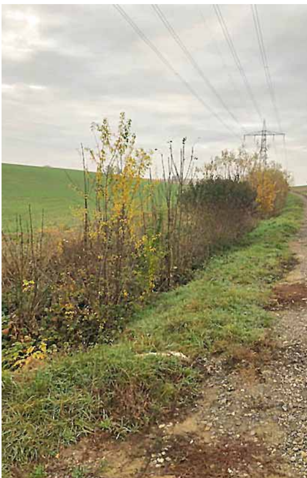
Rückschnitt Feldhecke vor einem Jahr