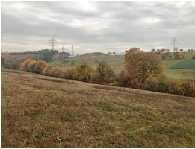
Rückschnitt Feldhecke vor fünf Jahren

Derzeit werden, nach einem festgelegten Pflegeplan, einige Feldhecken in kleinen Abschnitten zurückgeschnitten. Nach zwei Jahren, wenn dann wieder Jungwuchs entstanden ist, geht es mit der Pflege von einem höher gewachsenen Abschnitt weiter. Überwiegend betrifft dies Hecken an Feldwegen und Gewässern. In diesem Zuge werden die alten Hecken auf Stock gesetzt. Dies verhindert Überalterung und Verkahlung des niedrigen Heckensaumes durch zu hohen Bewuchs. In Abständen von ca. 30 Metern soll ab und zu ein höherer Baum in einer Feldhecke stehen bleiben. Heckenschnitt wurde früher durch die Landwirtschaft zur Brennholzgewinnung erledigt. Heute wird aus dem Heckenschnitt Energieholz gewonnen. Die Mitarbeiter des Bauhofes werden durch den Landschaftserhaltungsverband und den Gewässernachbarschaftstag regelmäßig geschult. In der Bebilderung einige schöne Resultate mit hohem Anteil an Jungwuchs von Hecken, die in den letzten Jahren gepflegt wurden.