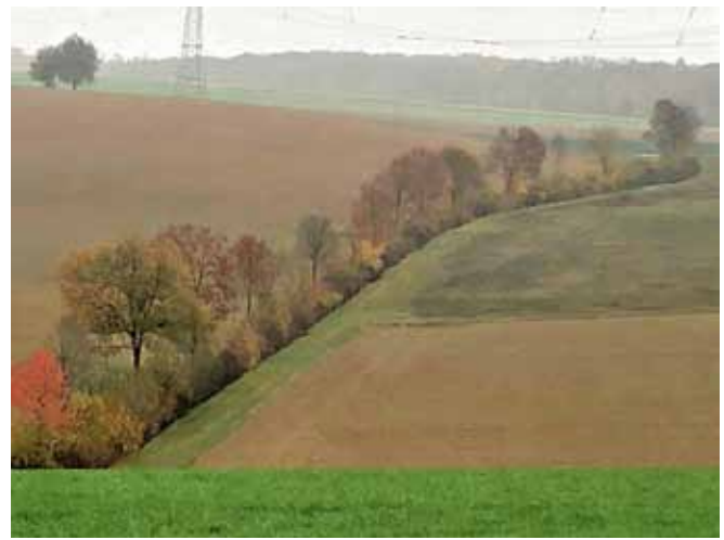
Rückschnitt Feldhecke vor zwei Jahren