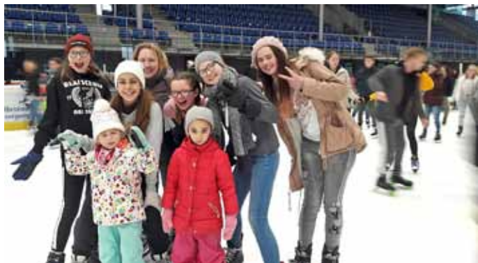
Es macht Spaß im Eisstadion