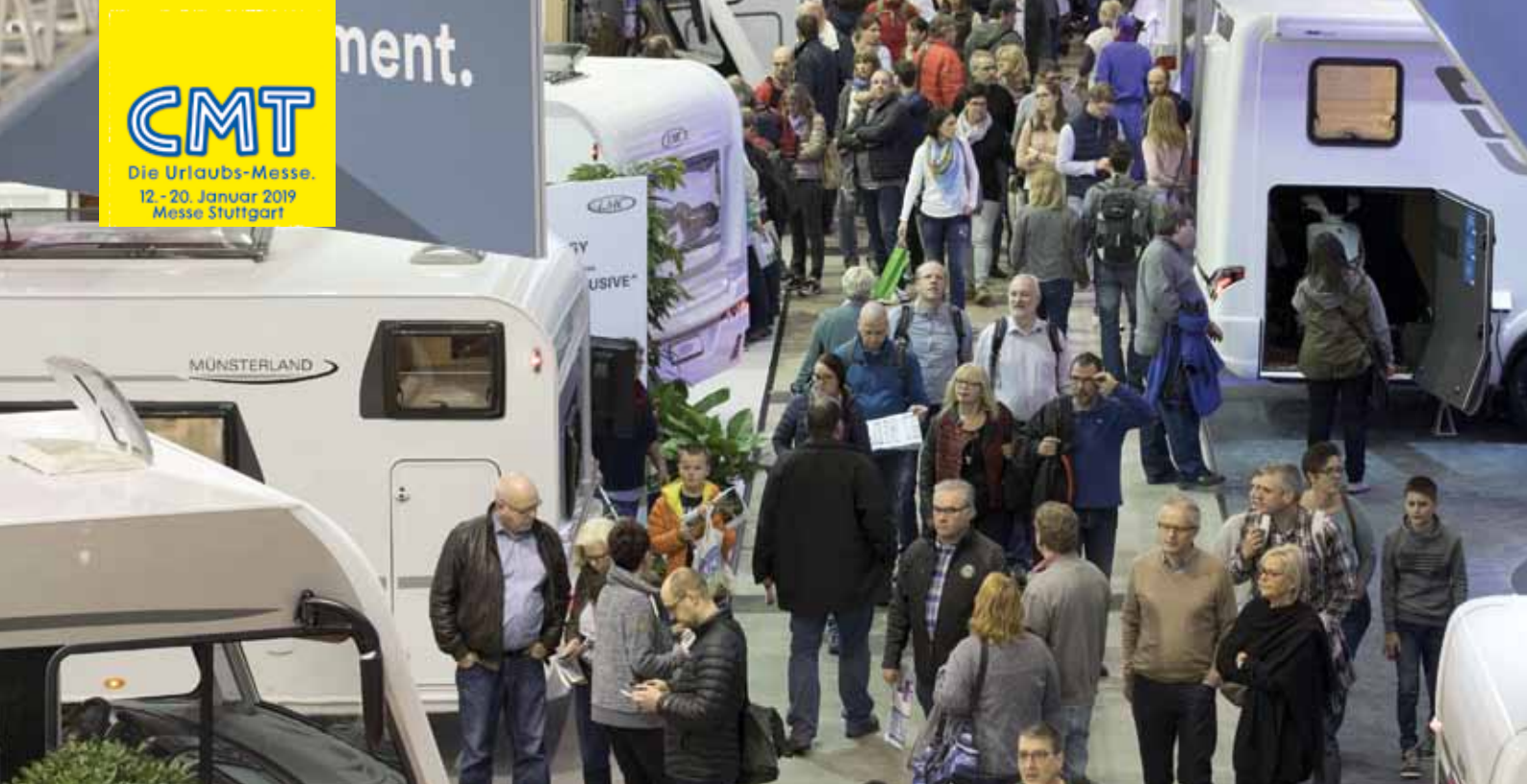
Die CMT ist die weltweit größte Touristikmesse.

CMT Die Urlaubs-Messe. 12.-20. Januar 2019 Messe Stuttgart