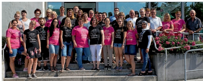
Die Absolventinnen und Absolventen 2019 der Berufsfachschulen für Altenpflege und Altenpflegehilfe der Johannes-Diakonie.