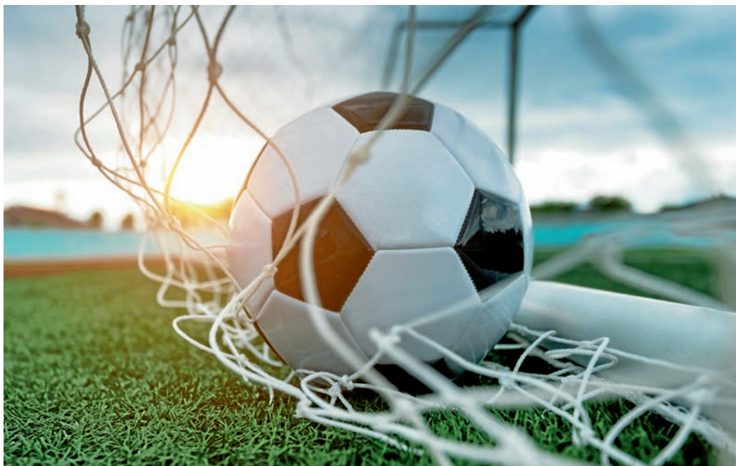
Vom Förderungsstopp und dem möglichen Verbot von Kunstrasen mit Mikroplastik sind über 700 Plätze allein in Baden-Württemberg betroffen.

Die Regierungsfractionen von GRÜNE und CDU haben daraufhin mit einer Mehrheit im Umweltausschuss beschlossen, dass es keine Zuschüsse des Landes mehr für mit Kunststoffgranulat verfüllte Kunstrasenplätze geben soll. „Faktisch bedeutet dies, dass im Moment keine neuen Bauprojekte in Angriff genommen werden können. Das hat zu Verunsicherung und Unverständnis bei uns und unseren Fußballvereinen geführt, zumal es derzeit keine gesicherten wissenschaftlichen Erkenntnisse zum tatsäch-