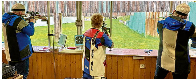
Die Hüffenhardter Schützinnen und Schützen bei der Kreismeisterschaft 2026

Die Ergebnisse der Kreismeisterschaft 2026 zeigen eindrucksvoll, dass der KKS Hüffenhardt sowohl in der Breite als auch in der Spitze hervorragend aufgestellt ist. Zahlreiche Kreismeistertitel, Podestplätze und starke Mannschaftsergebnisse unterstreichen die kontinuierlich gute Trainingsarbeit und den hohen Leistungsstand der Aufgaleschützen. Der Verein kann stolz auf seine erfolgreichen Teilnehmer sein und blickt motiviert auf die kommenden Wettbewerbe.