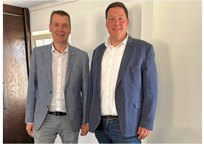
Auf dem Foto zu sehen sind die beiden Bürgermeister.

Beide Gemeinden verbindet nicht nur eine gemeinsame Gemarkungsgrenze, sondern auch die Zusammenarbeit in Zweckverbänden, insbesondere im Bereich der Wasserver- und Abwasserentsorgung. Themen des Gesprächs waren unter anderem aktuelle Herausforderungen der kommunalen Infrastruktur sowie Möglichkeiten, Synergien künftig noch stärker zu nutzen. Das Treffen unterstreicht die Bedeutung eines engen Austauschs zwischen Nachbarkommunen über Landkreisgrenzen hinweg.